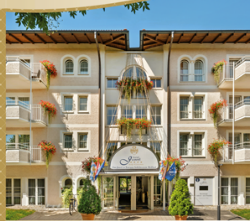
Preisliste gültig vom 03. Januar bis 19. Dezember 2023

Ein Haus der Privathotels Dr. Lohbeck GmbH & Co. KG Barmer Straße 17 · 58332 Schwelm